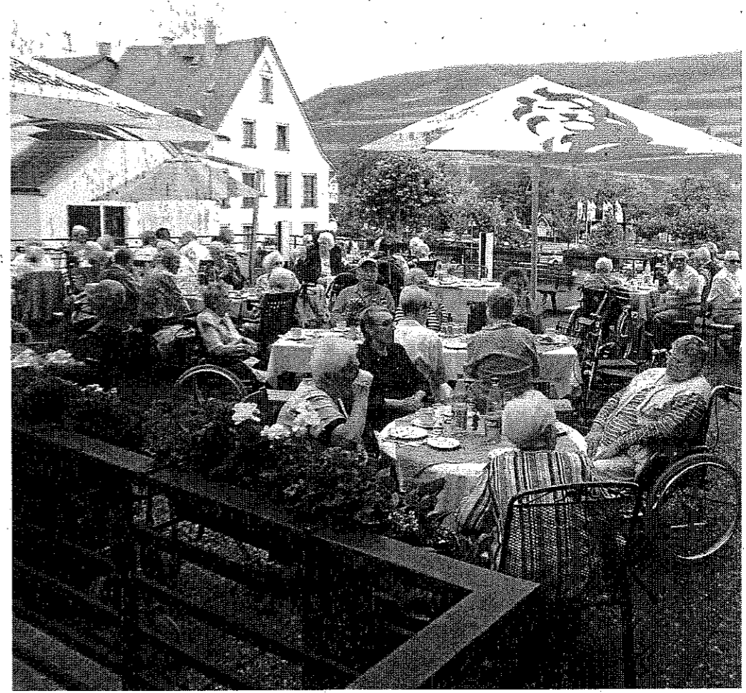
Klare Sache, Kaffee und Kuchen gab es natürlich auch. Schließlich ließen sich die Spender der Bingelbahn-Tour nicht lumpen.

clubs Ingelheim, der am vergangenen Wochenende sein Altstadtfest feierte. Und justement bei diesem Fest ist der arme Siggi dann offenbar häufiger nass geworden, weil es hin und wieder einmal regnete. Darauf und nur darauf bezog sich denn auch die Frotzelei, wie Verwaltungschef Gerhard eiligst beteuerte. Der kürzlich noch nasse und jetzt wieder